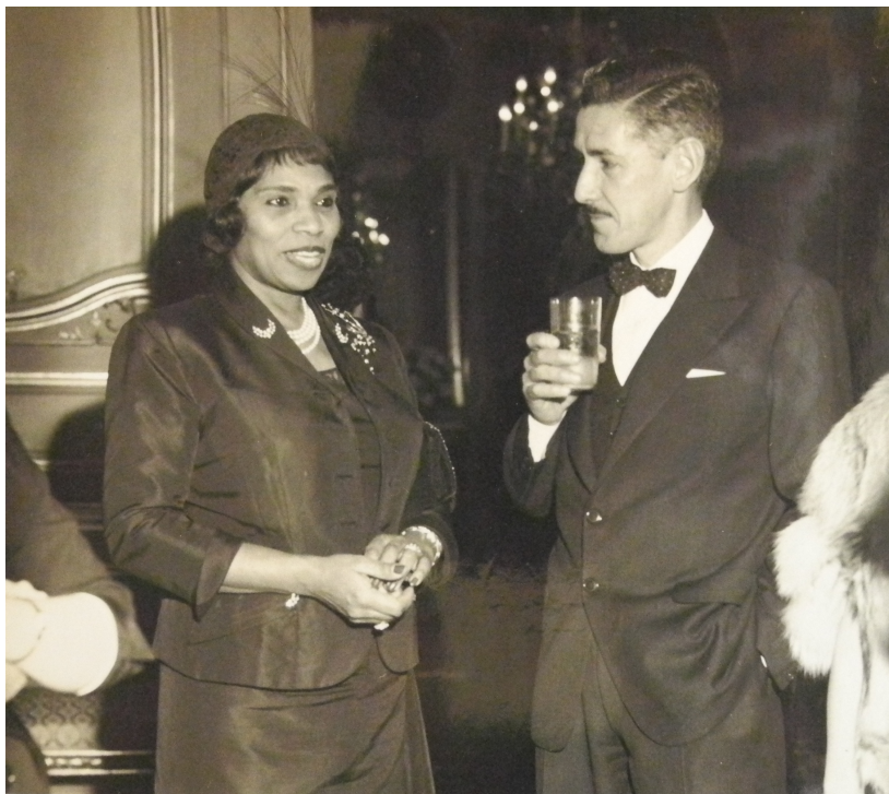
Figura 2. La contralto Marian Anderson y Carlos Guastavino, en Buenos Aires (1954).