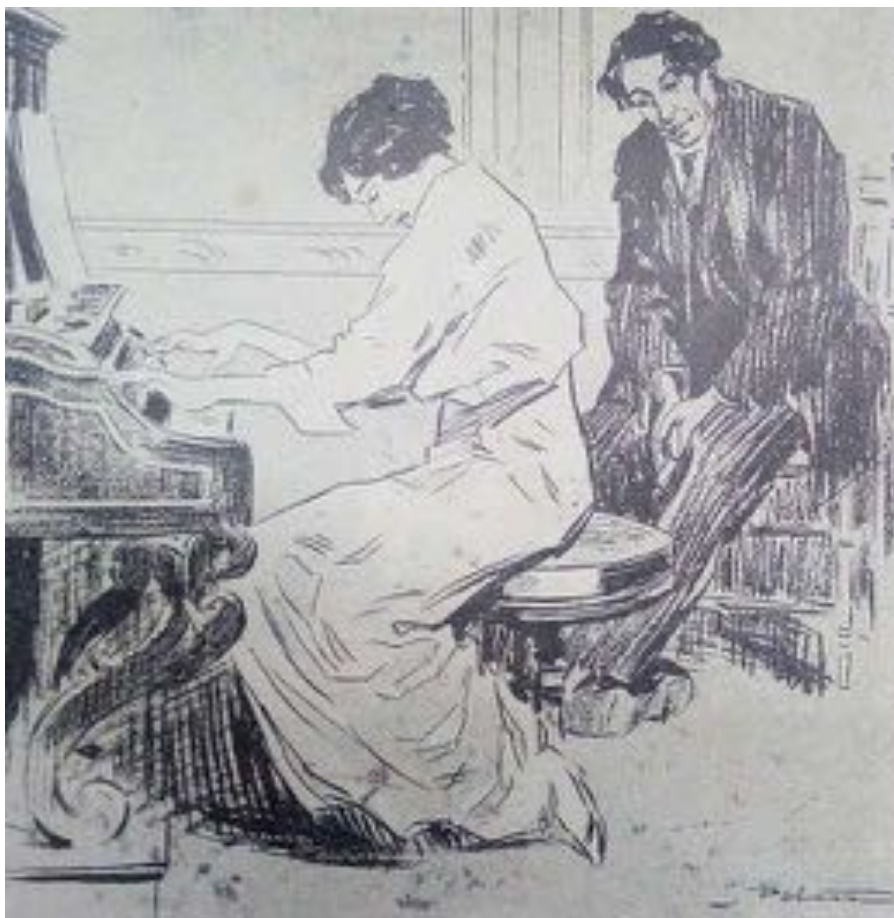
Imagen 4. Fray Mocha , Año II, N° 177, 17-IX-1913

Hasta Santo Discépolo fundó el suyo propio y quedó de algún modo representado, años más tarde, por su hijo Armando cuando junto a Rafael de Rosa, estrenaron en