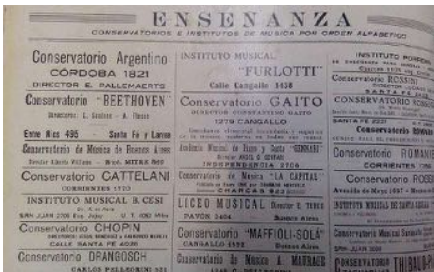
Imagen 3. Publicidad de conservatorios en la revista Correo Musical Sudamericano , 13-IV-1915, s/p

En el interior del país funcionaban las sucursales de algunos de los conservatorio de Buenos Aires, (como el mencionado de Alberto Williams) o instituciones creadas en cada provincia. Ejemplos de ello son el Conservatorio Juan Bautista Alberdi, en la