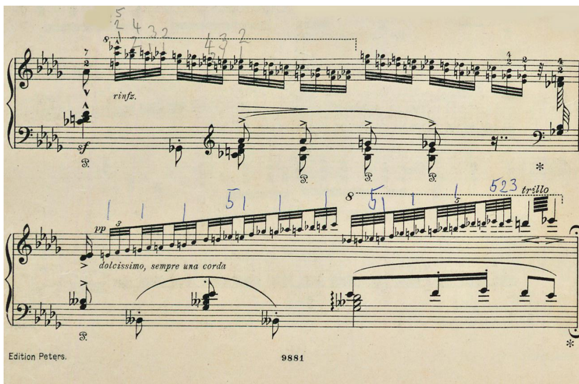
Imagen 5: Liszt- Verdi, Paráfrasis de Rigoletto

Finalmente, son interesantes las indicaciones que demuestran su absoluta entrega al material musical y fidelidad a la partitura, a través del permanente cuestionamiento frente a notas, fraseos y pedales. Esto explica los numerosos ejemplares de una misma obra en distintas ediciones.