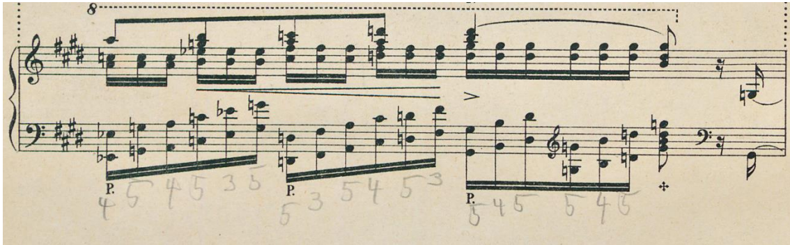
Imagen 3: Vallé d Obermann, página 16.

las octavas de la mano izquierda en Vallé d Obermann , en que el legato se realiza a través de la relación 4-5-4-5-3-5 evidenciando la flexibilidad de sus articulaciones.