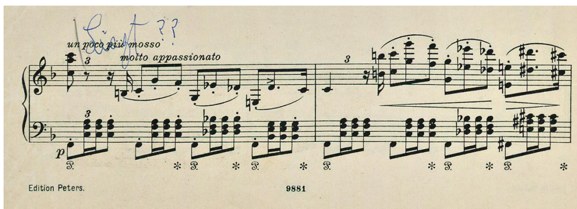
Imagen 6: Liszt- Verdi, Paráfrasis de Ernani

Finalmente, son interesantes las indicaciones que demuestran su absoluta entrega al material musical y fidelidad a la partitura, a través del permanente cuestionamiento frente a notas, fraseos y pedales. Esto explica los numerosos ejemplares de una misma obra en distintas ediciones.